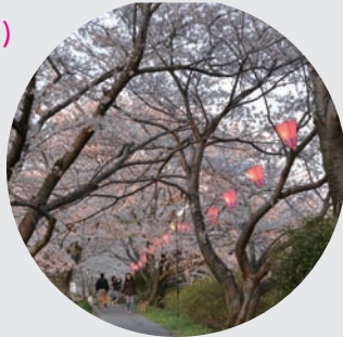
※本年は道路工事のためライトアップはありません

岩崎城と岩崎川の2か所が会場となり、歌に楽器の演奏に鳴子おどりと桜の下でいろいろ楽しめます。屋台もたくさんですよ!(^^)!