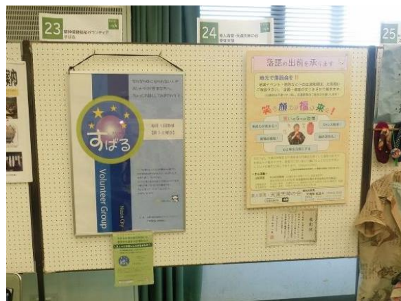
↑ 縦120cm×横90cm（1枚のパネルを2団体で使用）