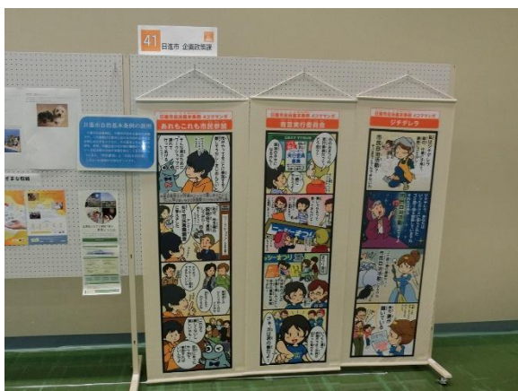
↑ パネルの下にのびるのはOK