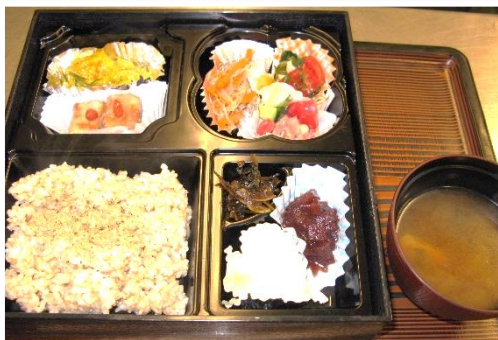
日替わりランチ 650円 この日は高野豆腐の揚げ煮など10品 素材を活かした創作料理が並びます

“自然を味わう”をテーマに、見て、食べて、自然の美味しさを感じていただけるお食事と飲み物（オーガニック・自家焙煎コーヒーや自家製発酵ドリンク）を提供しています。ぜひ一度ご賞味ください。