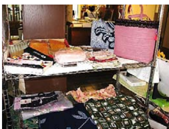
懐かしさを感じる小物たち。

お客様との出会いを大切に、会話や交流から手作りの知恵や活力を共有 できたらと願っています。ぜひお越し下さい。