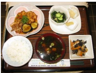
ひりょうす(がんもどき)醤油あん ときくらげの炒め物。

素材に謙虚に、心を込めた『自然食』をご賞味下さい。スタッフ一同、 心よりお迎えいたします。