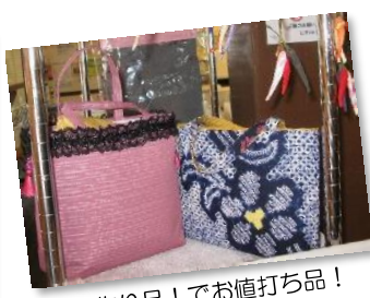
手作り品！でお値打ち品！ 世界に一つだけの品。