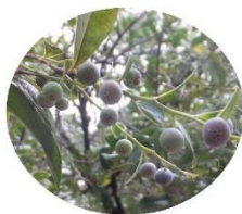
和製ブルーベリーの名を持つシャジャンボ

春のコバノミツバツツジが有名ですね。でも秋も負けていません。常緑樹の多い北高上緑地ならではの、秋の木の実をつけた里山の風景を楽しむことができます。