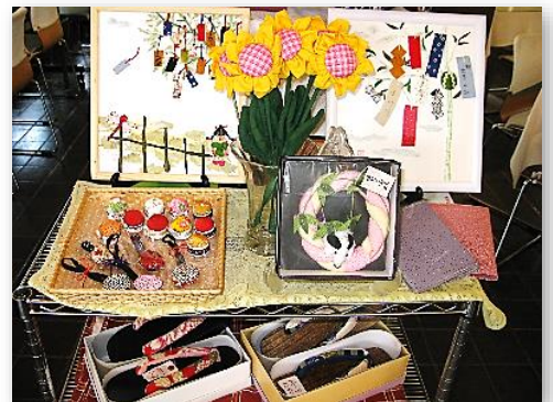
季節を感じるディスプレイ