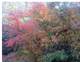
紅葉がきれいなカエデ

東部丘陵地の中にある里山で、名前の如く四季折々を感じることができる四季の森。秋深くなると、カエデの紅葉、タカノツメ、コナラ、アオハダなどの黄葉が見事です。