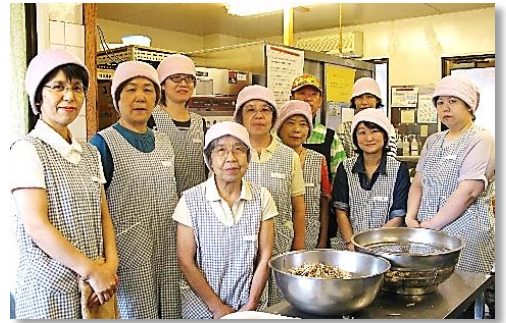
キッチンよつば スタッフ一同です(^)