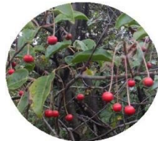
赤い実が可愛いソヨゴ