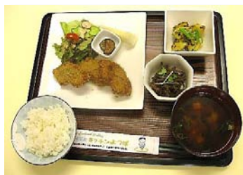
車麩カツとじゃが芋の高菜炒め。 とってもヘルシー!(^_^)