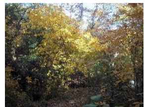
黄葉が見事なタカノツメ

紹介した里山は、日進里山リーダー会が保全活動を行っています。 ※くるりんばすの高齢者定期券は、にぎわい交流館でも販売しています。