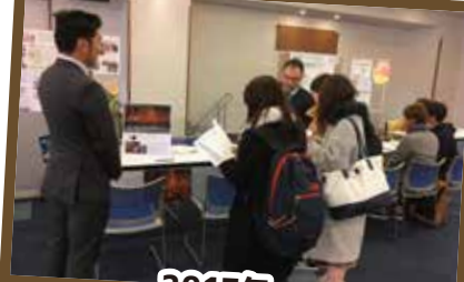
2017年 ボランティアマッチングイベント 「ボラみつけ」