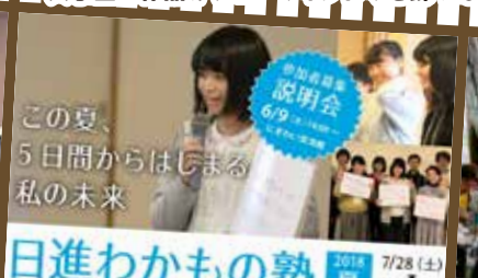
この夏、 5日間からはじまる 私の未来 日進わかもの塾 夏 2018 7/28(土) 8/26(日)