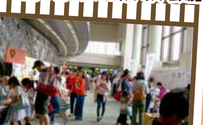
2016年～市民活動の祭典 「わいわいフェスティバル」

日進市役所の東隣にあるレンガ調の建物をご存知ですか?そう、それが「にぎわい交流館」です。