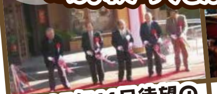
2005年11月待望の 「にぎわい交流館」開館