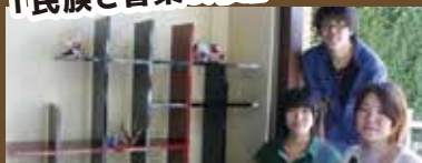
2009年～2010年 「大学交流推進事業」 大学生の作品がショーウィンドウを飾った