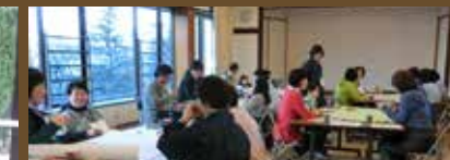
2015年～2018年 6回開催された みんなでおしゃべり「わいわい広場」