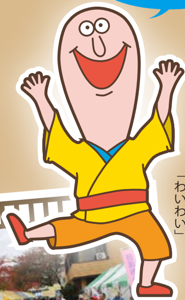
日進市にぎわい交流館 公式キャラクター 「わいわい」