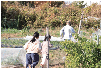
70代の元大学教授と子どもの鬼ごっこ↑